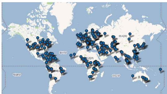
(그림 2) WiBro 네트워크 전개 현황

WiBro 상용화는 특정 지역(미국, 일본, 한국 등)을 제외하고 중동/아프리카, 아시아/태평양 지역의 GDP가 낮은 국가들을 중심으로 전개되고 있다. 그리고 현재 대다수 WiBro 사업자는 ISP로서 상용화 사업자 중 60%(117개)를 차지한다. 1) 여기서 알 수 있는 사실은 전세계적으로 특정 국가를 제외하고 GDP