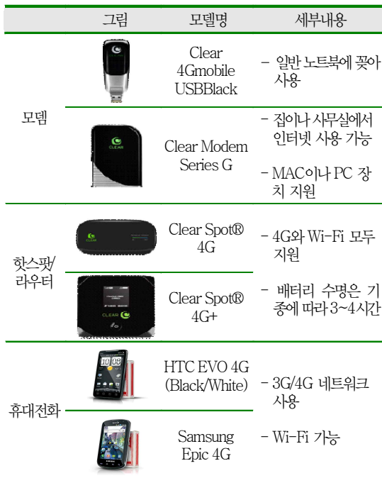
〈표 3〉 Clearwire 주요 단말기 현황

이에 더해, 4G 표준으로 선정된 WiBro 기술이지만 전세계 대다수의 사업자가 LTE에 몰두함에 따라 투자자들이 점차 WiBro에 대한 투자가 옳지 않음을 인지하였고, 그에 따라 투자된 비용을 빠르게 회수하는 방안으로 도매망 계약 시 ARPU를 적게 내는 방안을 강요할 수 있다는 것이다. 그리고 기본적으로 2차 투자가 줄어드는 것이 당연하지만 Clearwire에 대한 2차 투자는 1차 투자액인 32억 달러에서 3억 7,500만 달러로 급감하였고, 여기에 대주주인 Sprint나 구글 등은 더 이상의 투자를 포기하고 LTE 진영으로 돌아선 점을 미루어보아 투자사가 Clearwire의 WiBro 서비스에 거는 기대가 낮아지고 있음을 반증한