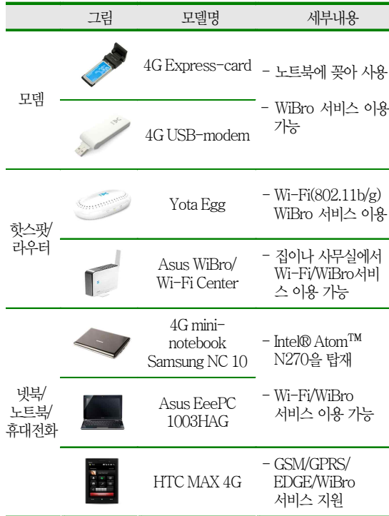
〈표 1〉 Yota 주요 단말기 현황