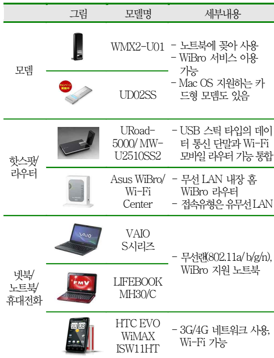
<표 2> UQ Communications 주요 단말기 현황

<자료>: UQ컴즈 홈페이지(www.uqcommunications.jp)