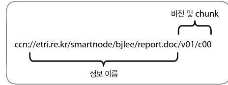
(그림 1) CCN 식별자 체계

CCN 이름은 계층적으로 구성되어 있다는 점에서 URL과 유사하나, URL과는 달리 주소 정보를 포함하고 있지 않다는 점에서 다르다. (그림 1)은 CCN의 계층적인 식별자 체계이다. 예를 들어 본 문서의 첫 번째 청