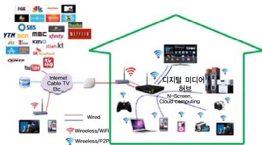
(그림 1) 디지털 미디어 허브 생태계

디지털 미디어 허브는 콘텐츠와 정보의 통합적인 제공을 위해 첫째, 인터넷 망, 케이블TV망, 위성방송망, 지상파방송망 등의 상업망과 WiFi, WiFi-Direct, NFC(Near Field Communication), ZigBee, Bluetooth 등 LAN(Local Area Network) 또는 PAN(Personal Area Network)과 같은 다양한 미디어와 연결성을 보장하여야 하고, 둘째, 디바이스와 OS에 구애됨이 없이 콘텐츠와 정보의 끊임없는 양방향 서비스가 보장되어야 하고, 셋째, 다양한 콘텐츠와 정보를 플랫폼에 제한 없이 제공하여야 하며, 넷째 디바이스와 사용자 간의 편리한 소통 기능, 다섯째, 기능 추가가 간편한 개방형 인터페이스 구조 등을 보장하여야 한다. 이를 위해 STB 및 SmarTV 디바이스 사업자, 통신 및 네트워크 사업자, 콘텐츠 및 방송 사업자, OTT(Over The Top)사업자, 인터넷 플랫폼 사업자 등 다양한 계층의 사업자들이 독자 또는 결합으로 상품 및 서비스를 출시하거나 준비하고 있다. (그림 1)과 같이 디지털 미디어 허브의 생태계를 나