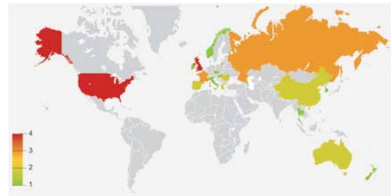
(그림 3) 세계 펠토셀 시장경쟁 수준 현황

<자료>: Informa Telecoms & Media, 2013, 2.