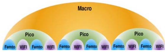
(그림 1) Heterogeneous Network 구성[3]