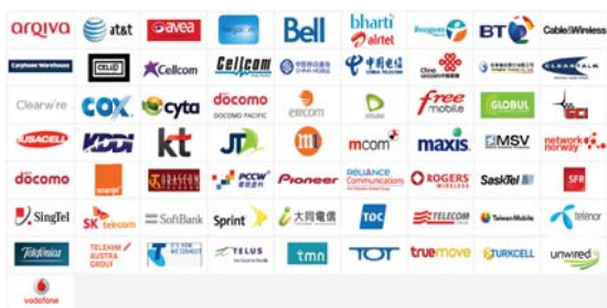
(그림 4) 스몰셀 포럼 회원 업체현황

<자료>: Informa Telecoms & Media, 2013. 2.