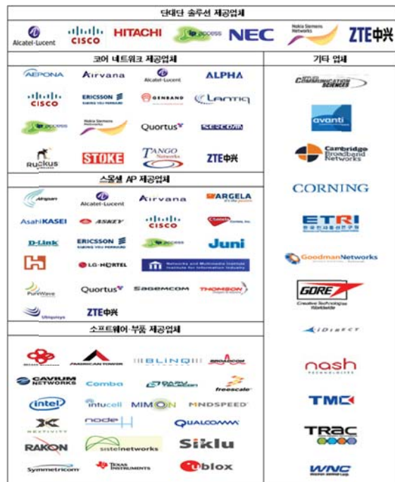
(그림 5) 스몰셀 생태계

<자료>: Informa Telecoms & Media, 2013. 2.