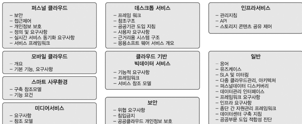
(그림 3) TTA 클라우드 컴퓨팅 관련 표준 제정 내용 요약

국내외 클라우드 컴퓨팅 기술 현황을 분석하여, 관련 기술 개발의 표준화 방향 제시, 응용산업분야 법, 제도 개선안 도출 및 정부, 학계, 산업체들 간의 클라우드 컴퓨팅 기술정보 공유를 목적으로 2009년 7월에 클라우